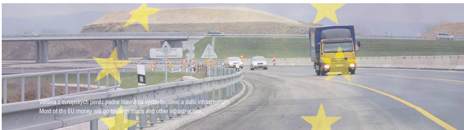
Většina z evropských peněz padne hlavně na výstavbu silnic a další infrastruktury. Most of the EU money will go towards roads and other infrastructure.

Calls for proposals will be published by the Regional Council of NUTS Moravia-Silesia.