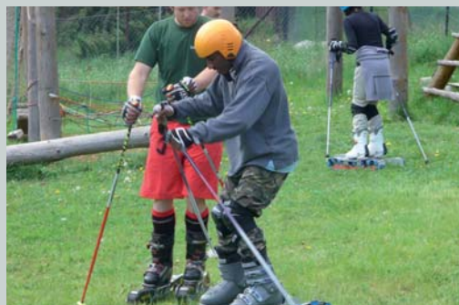
Studenti z partnerského regionu Lotrinsko poprvé na travních lyžích Students from the partner region of Lorraine on grass skis