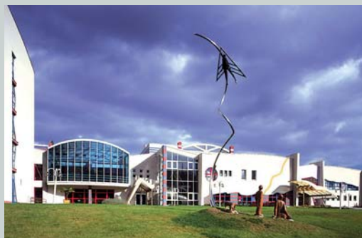
Lázně Klimkovice Klimkovice Spa