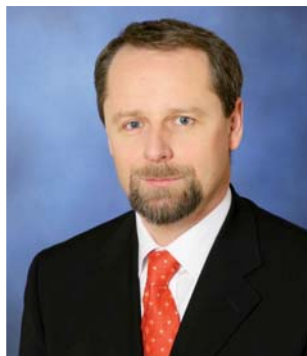
Martin Říman, ministr průmyslu a obchodu / Minister of Industry and Trade

The new Operational Programme Enterprise and Innovations, run by the Ministry, earmarks funding for brownfields regeneration through the Real Estate programme, which will be launched in the second half of 2007 on completion of official negotiations with the European Commission. This programme will focus on regenerating industrial sites for processing industries and related services. Most brownfields in the Czech Republic were previously industrial sites (34%) or agricultural land (32%). Of the remaining third, the majority were public buildings (12%) and military sites (7%).