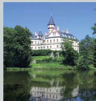
Zámek Raduň Raduň Chateau